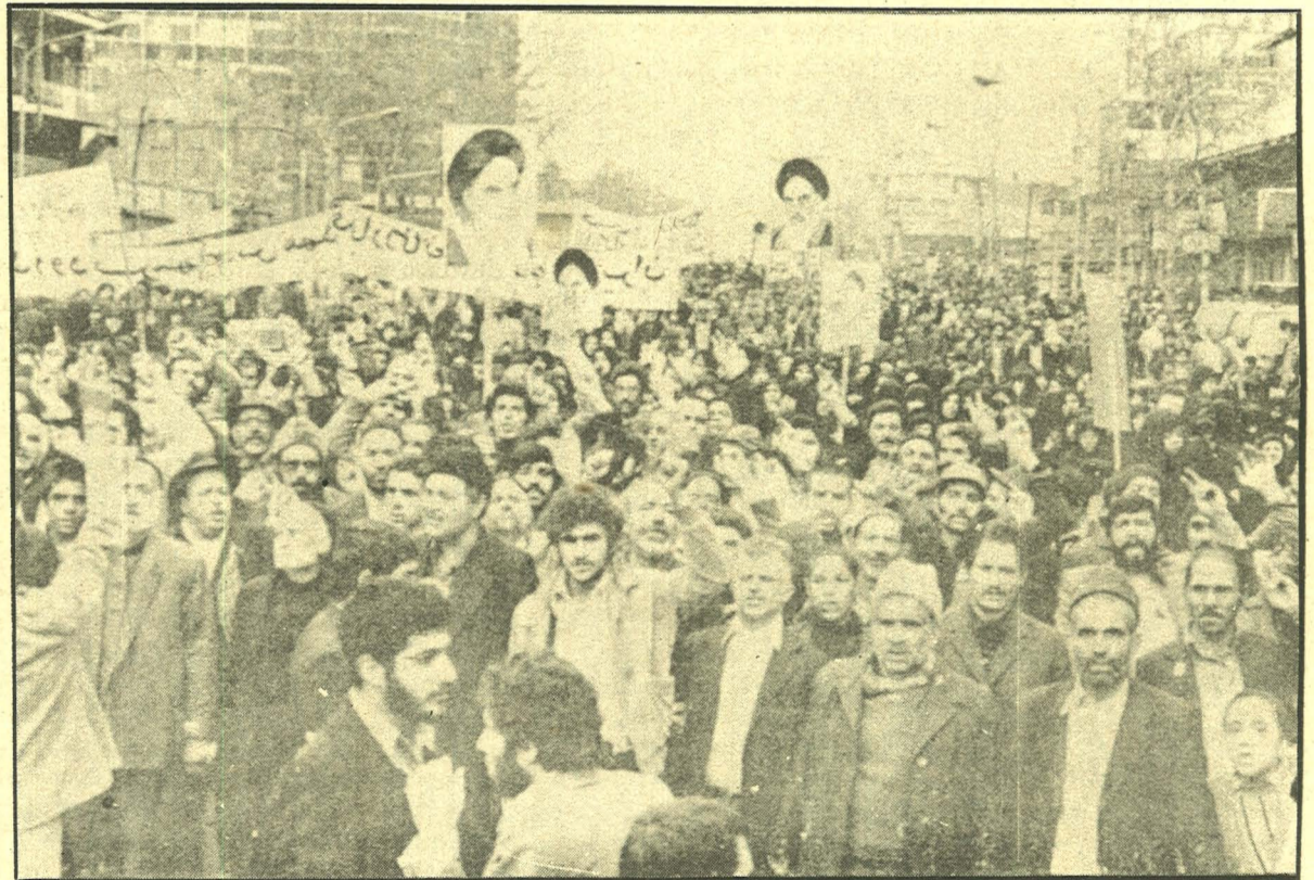
Mısır'da Humeyni lehindeki gösterilerden bir enstantane

Bu arada Tunus'un da Mısır ile diplomatik ilişkilerini kesmeye karar verdiği açıklanmıştır. Tunus'un Kahire Büyükelçisi Habib Nuira ise, 3 Nisan'da geri çağırılmıştı.