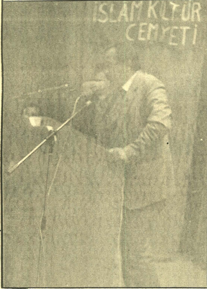
★ Başyazarımız Kadir Mısıroğlu Avrupa'daki İslamcılarla görüşmelerine aralıksız devam etmektedir. Geçtiğimiz pazar günü Hamburg'da kalabalık ve uyum bir Müslüman topluluğuna hitap etmiştir.

Bilhassa geçen Pazar günü Hamburg'da kalabalık bir topluluğa hitap eden başyazarımız öğlen namazını müteakiben başlattığı konuşmasını akşam namazına kadar tam altıbuçuk saat sürdürerek âdeta rekor kırmıştır. Her meşreb ve görüşteki insanın iştirak ettiği bu toplantıda ülkemizin maddden ve mânen nasıl geri bırakıldığı üzerinde duran başyazarımız, müteakiben muhataplarının çeşitli sorularını cevaplandırmıştır. Bu sorular arasında "MSP'nin anarşistleri afv ettiği ve CHP ile ortaklık yaptığı" gibi bilhassa AP'lilerce bir tezdin kampanyasına sermaye kılınanlar dikkati çekmiştir. Bunları bütün dinleyenlerin takdir ve tasviplerine dikkati çekmiştir. Bunları bütün dinleyenlerin takdir ve tasviplerine mazhar olacak şekilde cevaplandıran Kadir Mısıroğlu, Milli Görüş'ün neden siyâset sahnesindeki en haklı görüş olduğu gerçeğini ortaya koymuştur.